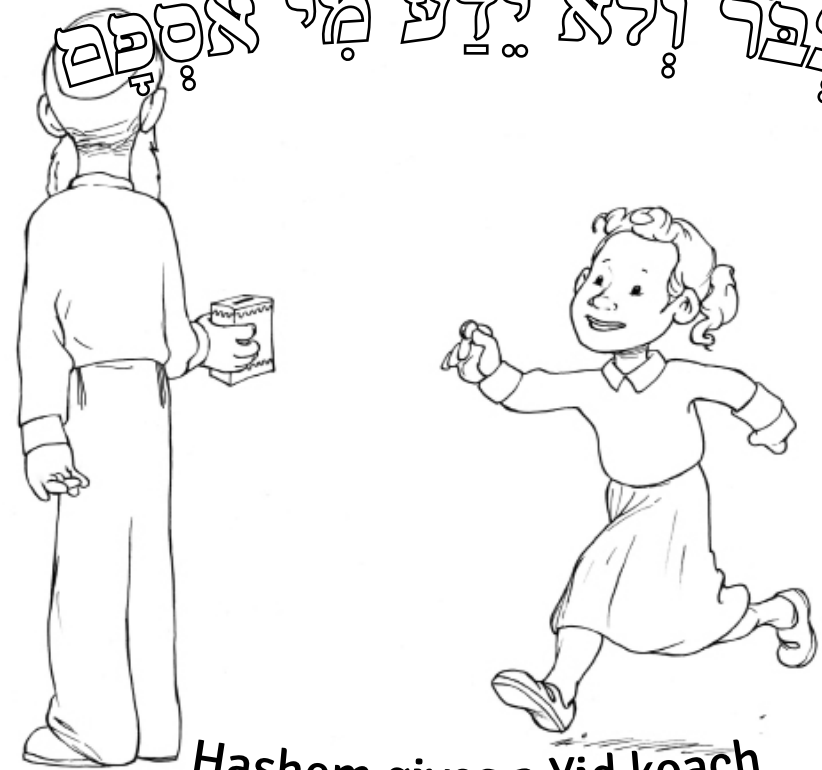
Hashem gives a Yid koach that helps him serve Hashem with chayus.

אֶדָּבַר בְּצִלּוֹם יְתְהַלֵּךְ אִישׁ אֶדָּבַר הַבֵּל יִהְיֶה מִיּוֹן וַיִּצְבֹּר וְלֹא יֵדַע מִי אֲסֻפָּם