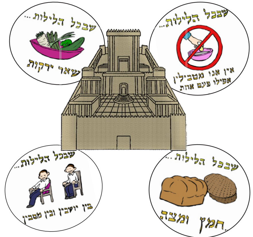
Mah Nishtana talks about Golus and Geulah!