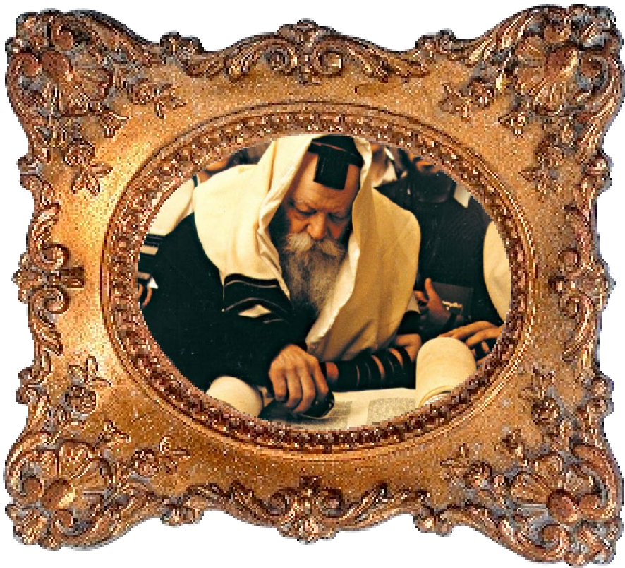
A Rebbe gives us koach to have Yiras Shomayim

”אטו יראָה מילתא זוטרתִי היא אין לגבי מלשה מילתא זוטרתִי היא וכו'”