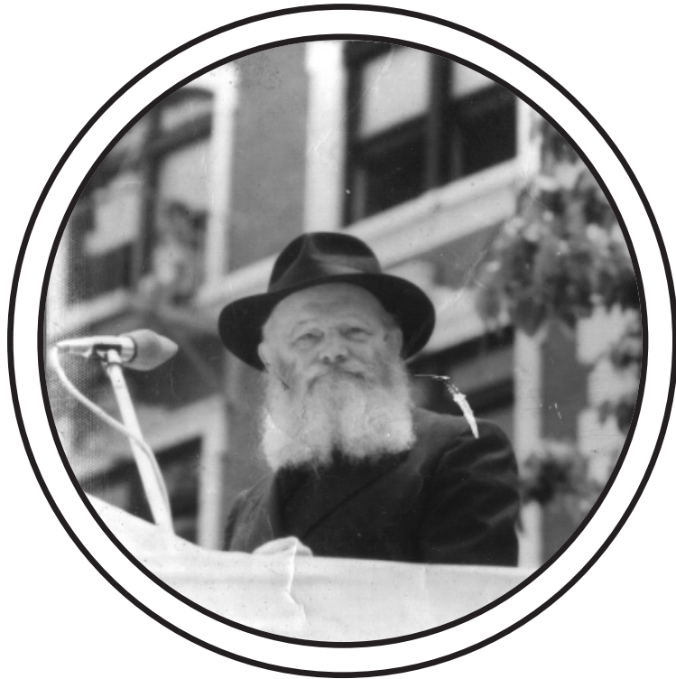
Notre chli'hout maintenant, c'est d'amener Machia'h !

צַדִּיקִים יִרְשׁוּ אֶרֶץ וְיִשְׁכְּנוּ לְעַד עַלְמֵיהֶם