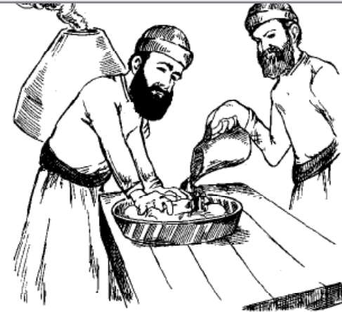
Les cohanim et les léviim n'ont pas le droit d'échanger leur travail.

מצות עשה ל"ו: " וְכִי יָבֹא הֵלֹוִי וְגו' וּבָא בְּכָל אֹת נִפְשׁוּ וְגו' וְשֵׁרֵת בְּשֵׁם ה' אֱלֹקֶיךָ כְּכֹל אֲחֵי הַלְוִיִּם הָעֹמְדִים שָׁם לִפְנֵי ה' חֶלֶק כְּחֶלֶק יֹאכְלוּ" (פרשת שופטים)