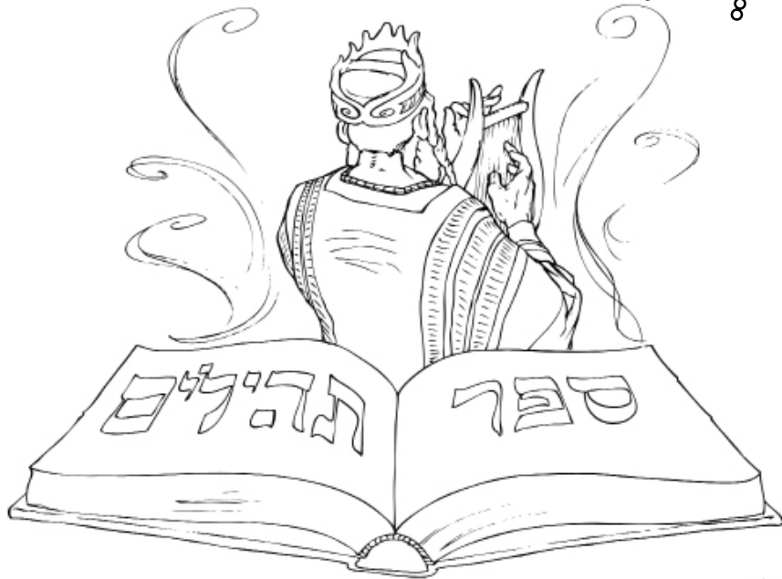
Illustration by [Signature]

לְמַנְצֵת מִזְמוֹר לְדָוִד׃ יַעֲנֶנּוּ ה' בְּיוֹם צָרָה יַעֲלֶנּוּבָהּ שֵׁם אֱלֹהֵי יַעֲקֹב׃