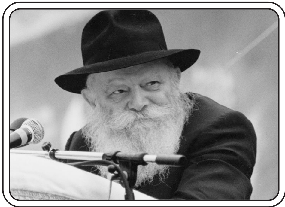
י"א ניסן איז "מזלו גובר" פון יעדער חסיד