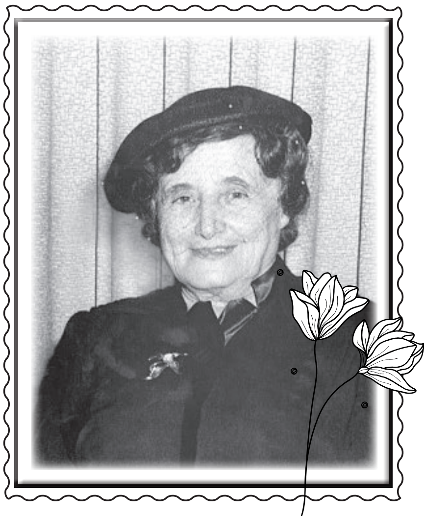
היינט איז די יארצייט פון רביצין חנה - דעם רבינ'ס מאמע