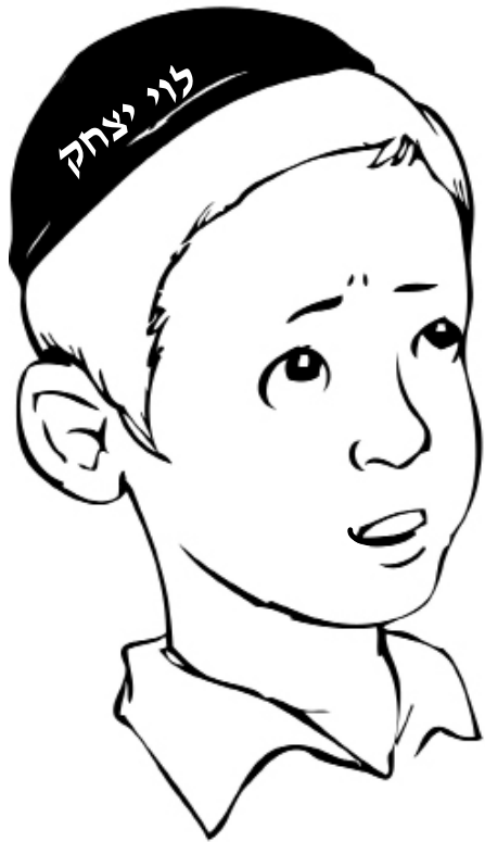
א חסיד פילט

"בא כבוד קדושת אבותינו רבותינו הקדושים, איז... געווען א עבודה פון דערמאנען פינו לבין עצמו די מקושרים, אין אריינטראכטן בענין אהבתם והתקשרותם פנים הפנים"