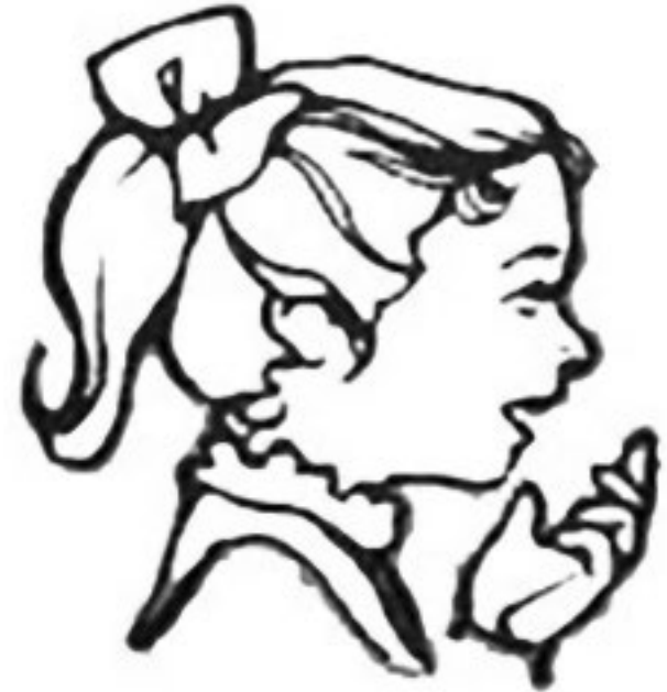
ה'ס רייד איז אנדערש