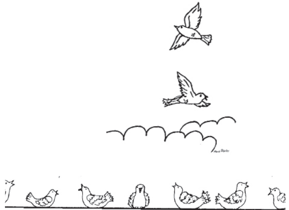
אן כוונה קענען אונזער מצוות נישט עולה זיין למעלה און שטיין פאר ה' ☹️

"וּכְמוֹ שְׂכֵתוֹב בְּתִיקוּנֵי דְבָלָא דְחִילוֹ וּרְחִימוֹ לֹא פְרָחָא לְעֵילָא וְלֹא יִכָּלָא לְסַלְקָא וּלְמִיקָם קָדָם ה' "