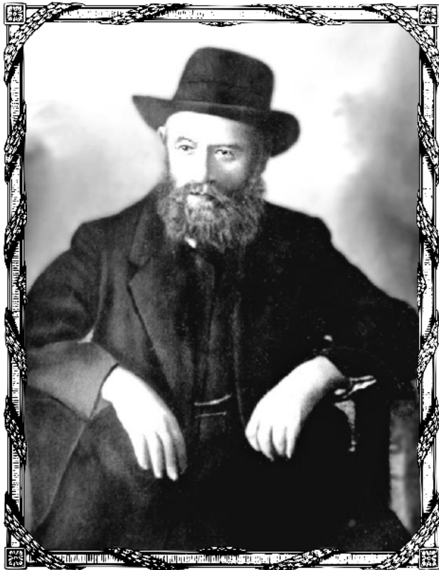
היינט איז די יארצייט (הילולא) פון דער רבי רש"ב

"הילולא של כבוד קדשת אדוני אבי מורי ורבי. נסתלק אור ליום א' ב' ניסן שנת תר"ף בראסטאב. ושם מנוחתו כבוד."